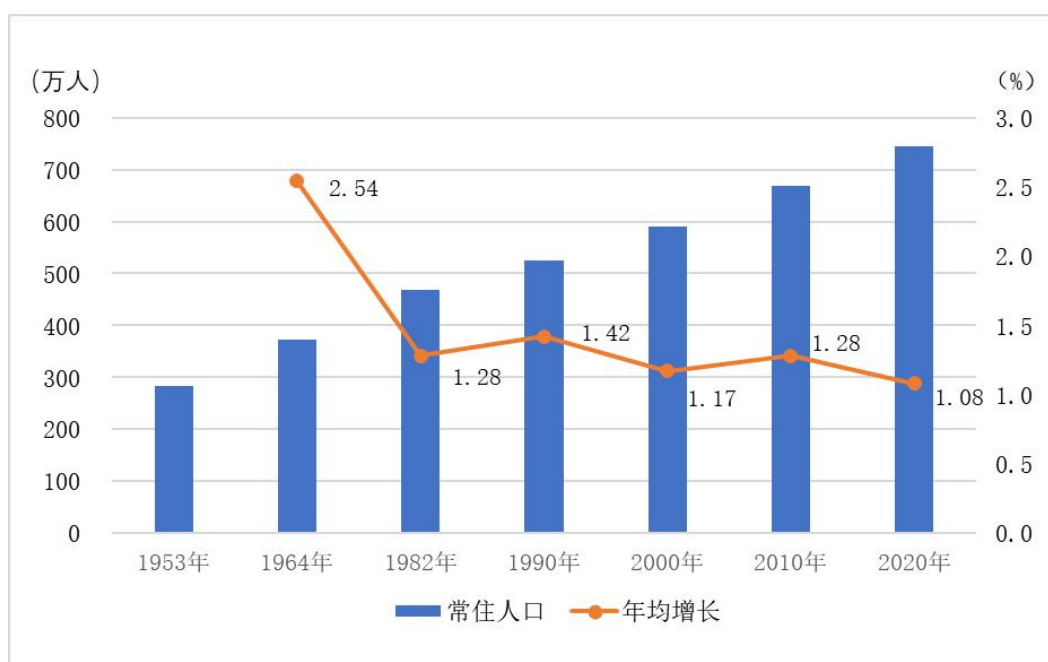
图1-1 大连市历次人口普查常住人口及年均增长率

全市常住人口与2010年第六次全国人口普查的6690432人相比，增加760353人，增长11.36%，年平均增长率为1.08%。